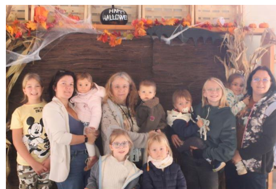
Sainte-Croix FÊTE HALLOWEEN