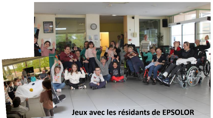
Jeux avec les résidents de EPSOLOR